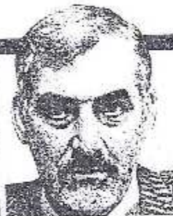
Por Manuel María