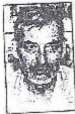
Por Manuel María

Gustaríanos que os poetas monfortinos se buscaran o rostro invisible a súa cidade e, cras polabros ritmados e sagradas da tribo — as mais antigas e as máis fermosas — nos contaran como é ese rostro, orda un no seu relicto, partindo das súas invisibilidades, das velles fotografías. Estas xentosas ab os poden comunicar coas palabras dunha creación. Nos sospitamos que o rostro invisible de Monforte de Lemos, delicadamente lexicónimo, ten a gracia da gótica e a suntuosa resplandecencia, rutilante veido por unha misteriosa beleza que, sen fábula, naceu na praza rúbrica de Beñito Vico.